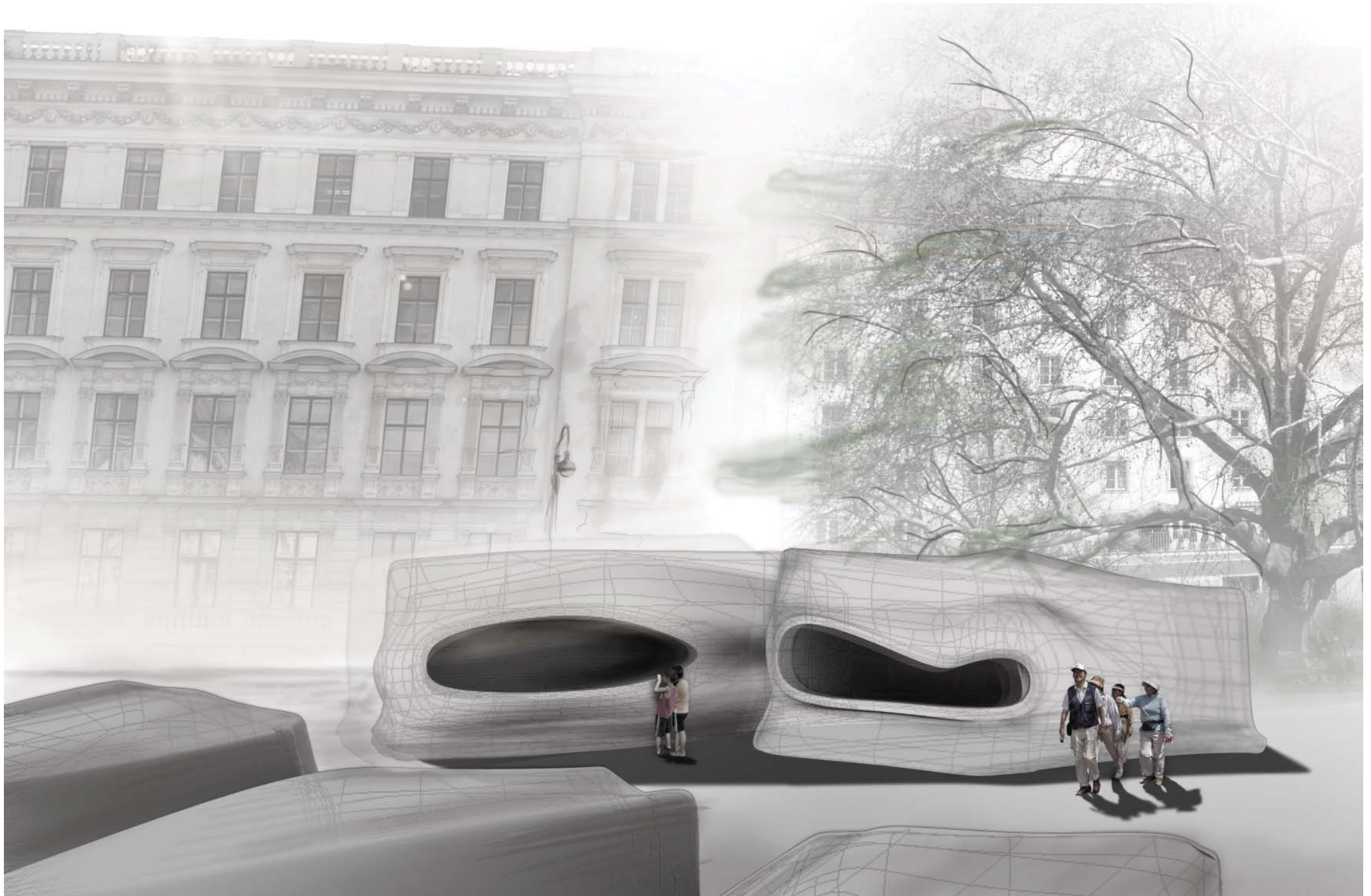
Perspektive Blick auf Aushöhlungen der Klangkörper. Das Mahnmal beansprucht Respekt aber auch spielerische Neugier.